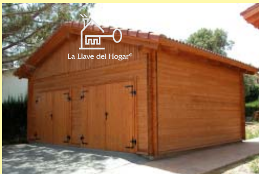
Fachadas frontal y lateral, con las puertas de apertura hacia el exterior del garaje