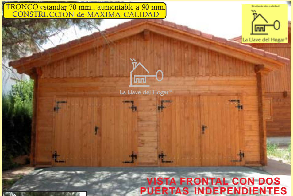
VISTA FRONTAL CON DOS PUERTAS INDEPENDIENTES

TRONCO estandar 70 mm., aumentable a 90 mm. CONSTRUCCIÓN de MAXIMA CALIDAD