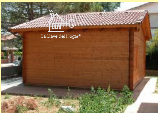
Fachada lateral del garaje con el tejado doble de teja autoventiladas y con aislantes en el mismo