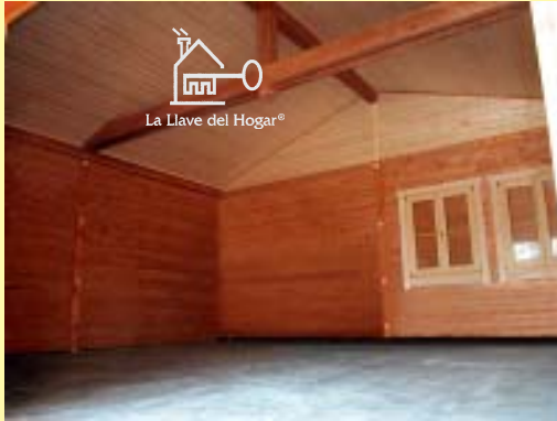
Interior del garaje con las puertas abiertas