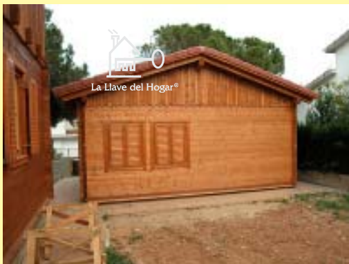
Posterior con doble ventana, juntas o separadas

TRONCO estandar 70 mm., aumentable a 90 mm. CONSTRUCCIÓN de MAXIMA CALIDAD